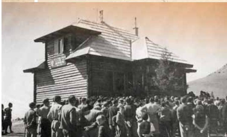
HPD Bjelašnica svečano otvara svoju kuću na Bukoviku iznad Sarajeva 16. 10. 1935. Godine 1945. oduzeta joj je i poslije predana drugom društvu