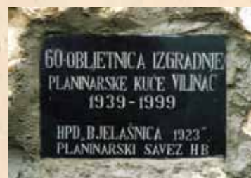
Spomen-ploča na ruševini kuće Vilinac